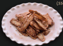
国産ごぼう使用 ごぼうチップス ¥390 (429)