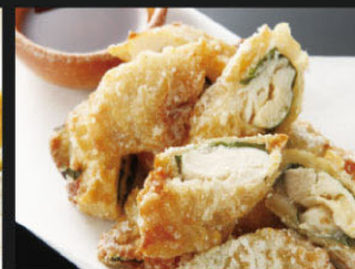
ささみ明太子チーズ揚げ ¥550 (605)