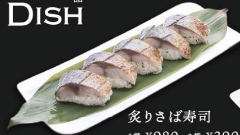
炙りさば寿司 5貫 ¥980 (1,078) 2貫 ¥390 (429)