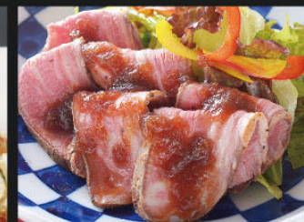
和牛ローストビーフ ¥1,400 (1,540)