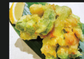
海老アボカド塩かき揚げ ¥630 (693)