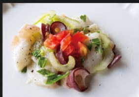
北海道産生タコのカルパッチョ ¥750 (825)