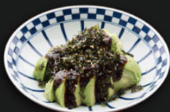
※写真は(大)です 海苔わさアボカド 大 ¥600 (660) 小 ¥390 (429)