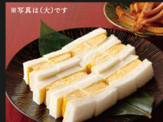
厚焼き玉子サンド パン耳ラスク付 大(12切) ¥1,300 (1,430) 小(6切) ¥700 (770)