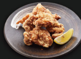
国産大山どり使用 和風醤油からあげ ¥600 (660)