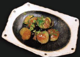
揚げ茄子の味噌和え ¥390 (429)