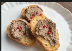
大山どりのレバーペースト ¥450 (495)