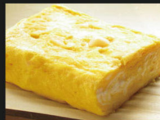
厚焼き玉子 ¥500 (550)