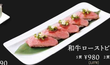
和牛ローストビーフ握り 5貫 ¥980 (1,078) 2貫 ¥390 (429)