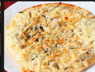
釜揚げしらすピザ ¥1,000 (1,100)