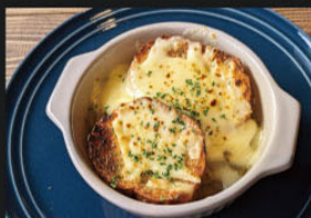
オニオングラタンスープ ¥500 (550)